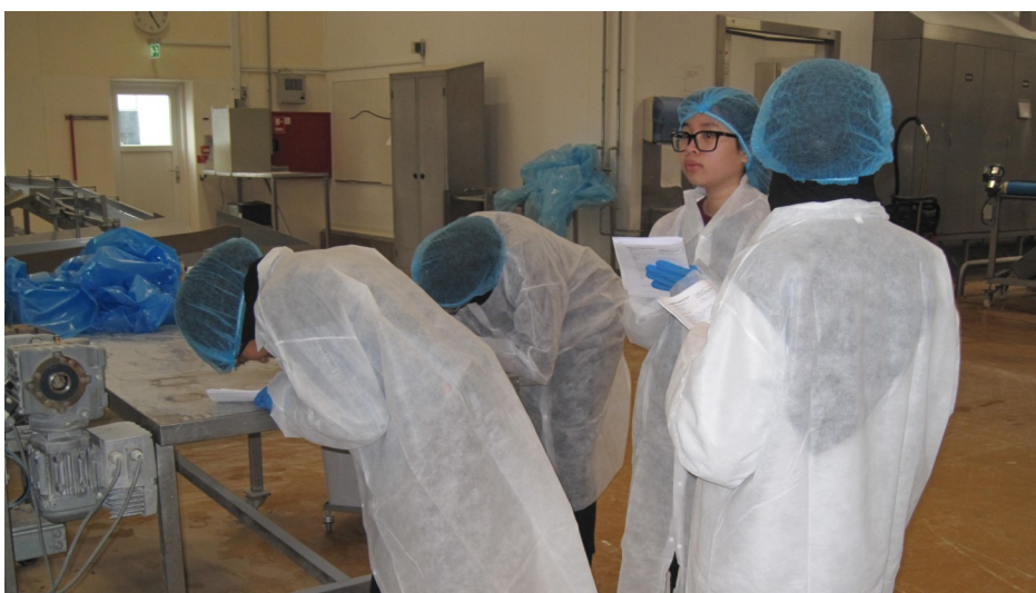
Eleverne er godt i gang med arbejdsprocessen.

Vores seks elever der medvirkede i projektet: